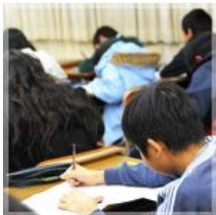
浜学園の塾生も受験している 「公開学力テスト」

ご希望される方へは、浜学園公開学力テスト(受験料は塾生料金)を受験していただけます。受験時点での学力を測ることができるとともに、弱点分野の発見などでその後の学習の指針を得ることができます。また、偏差値により志望校への合格確率を知ることができます。