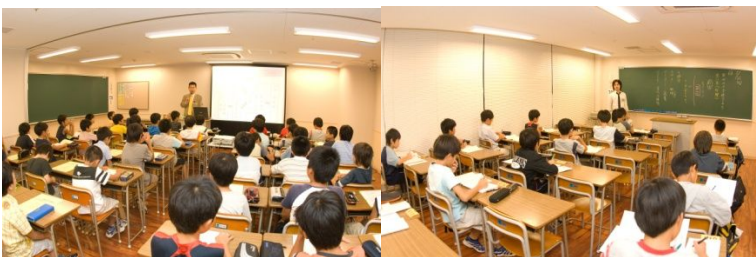
* 浜学園の授業・イベント風景

浜学園では中学受験指導の中心として「一般コース」を位置づけ、平日に通塾するコースを設けています。この「一般コース」を中心とする浜学園塾生は、毎年近畿、中部を中心とした最難関中学校、難関中学校に多くの合格者を輩出しております。